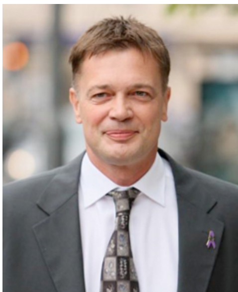
Dr. Andrew Wakefield

Jeden tím lekárov prišiel s možným dôkazom o súvise vakcíny MMR a autizmu. Štúdia bola v roku 1998 zverejnená v The Lancet , jednom z najprestížnejších lekárskeho časopisov na svete. Dr. Andrew Wakefield a kolegovia z londýnskej Kráľovskej nemocnice (Royal Free Hospital), podali správu o špecifických črevných symptómoch u dvanástich postupne zaočkovaných detí, ktorým boli diagnostikované poruchy autistického spektra a ďalšie hendikepy a prehlásili možné spojenie s očkovaním MMR. Hneď po publikovaní štúdie čelili doktori obrovským útokom z médií, od výrobcov vakcín, vlády, britskej Všeobecnej lekárskej rady ( General Medical Council , GMC) ako aj mnohých zástupcov lekárskej obce. Boli obvinení z neprofesionálneho správania, vyhodení z práce a v marci 2004 GMC oznámila, že hodlá začať vyšetrovanie.